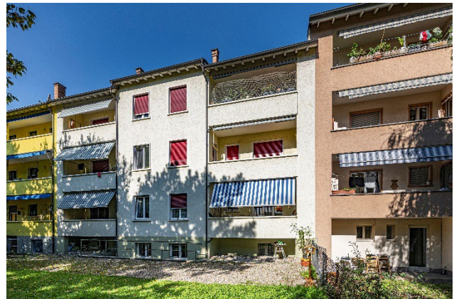
Luzernerring 115 – Ansicht vorne und hinten

Der Kaufpreis lag bei CHF 2'500'000.00 bei einem Gebäudeversicherungswert von CHF 1'887'000.00. Dabei ist zu bedenken, dass bei diesem Betrag der Bodenwert nicht enthalten ist. Die Liegenschaft hat das Baujahr 1944 und ist gut unterhalten. Aus diesem Grund sind keine grösseren Sanierungs- und Instandstellungsarbeiten in den nächsten fünf bis zehn Jahren geplant. Das Gebäude umfasst, neben den üblichen Allgemeinräumen, sechs 3-Zimmerwohnungen von je 75m 2 . Die Grundrisse sind fast identisch wie jene an der Sierenzerstrasse.