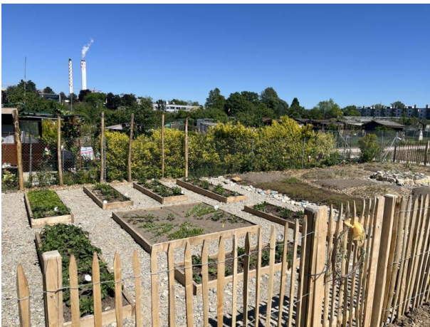
Lerngartenanlage von Bioterra

Mit der Aufwertung der Landschaft zwischen Hangkante und Schrebergärten wurde kurz vor Ende Jahr begonnen. Neben dem Erstellen einer weiteren Treppe zum Eiszeitenweg, wurden entlang der Schrebergärten ein neuer öffentlicher Weg erstellt. Im hinteren Teil wurde vom Verein Bioterra Schweiz ein Lerngarten angelegt, den man nach vorgängiger Anmeldung besuchen kann.